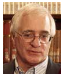
マイケル・クスmano 教授