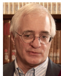
マイケル・クスmano教授